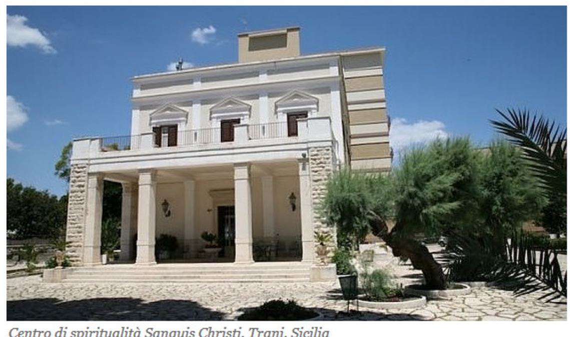
Centro di spiritualità Sanguis Christi, Trani, Sicilia

L'iniziativa del portale dell'ospitalità religiosa. Conventi, monasteri e strutture religiose aprono le porte per consentire una piccola vacanza estiva anche a persone in difficoltà. Ecco come funziona, in 50 strutture tra Roma e Assisi, ma anche tra mare e montagna