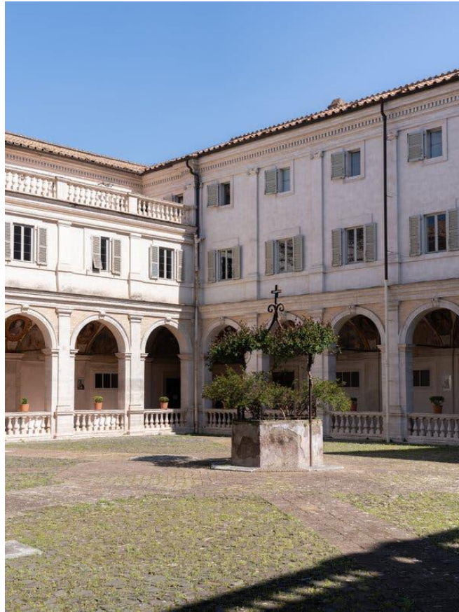
Il cortile e il chiostro vicino all'ingresso della struttura.