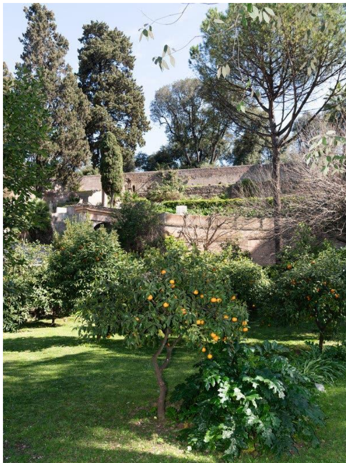
Il giardino della Casa per Ferie San Giuseppe alla Trinità dei Monti.