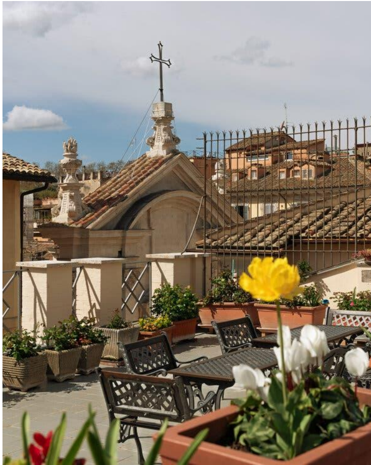
La terrazza della Casa di Santa Brigida.