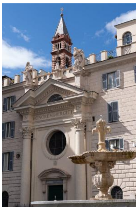
La Casa di Santa Brigida si trova in un palazzo del XV secolo vicino a Palazzo Farnese, nel centro storico di Roma.