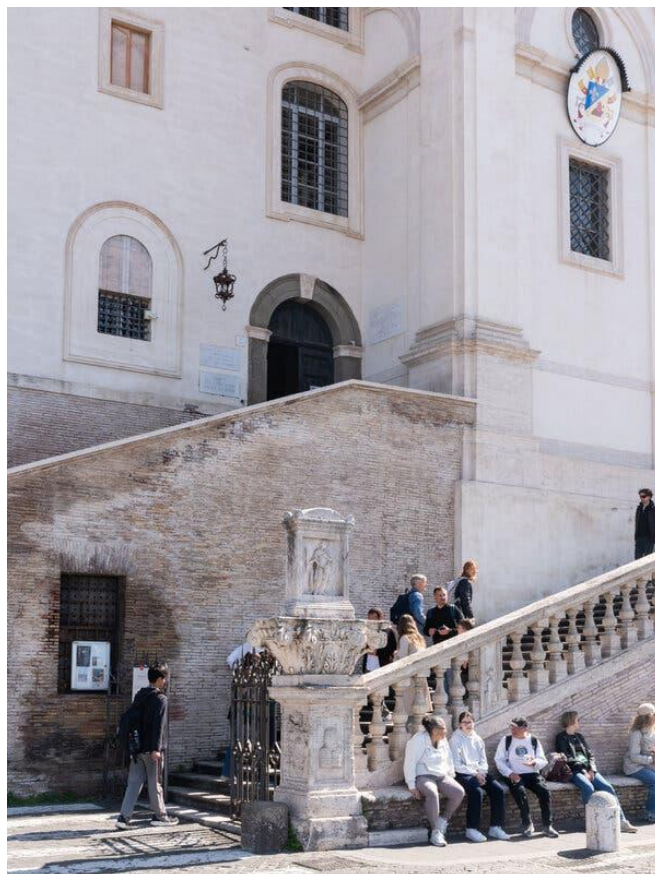
L'ingresso della Casa per Ferie San Giuseppe alla Trinità dei Monti, accanto a Piazza di Spagna.