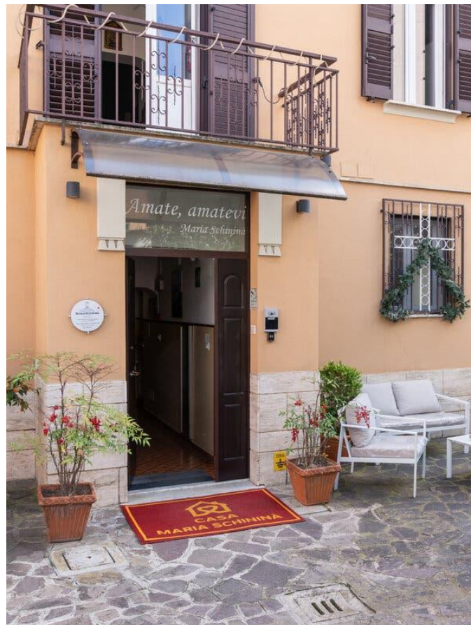
La Casa per Ferie Maria Schinina è nascosta in una tranquilla strada residenziale vicino a Corso Trieste.