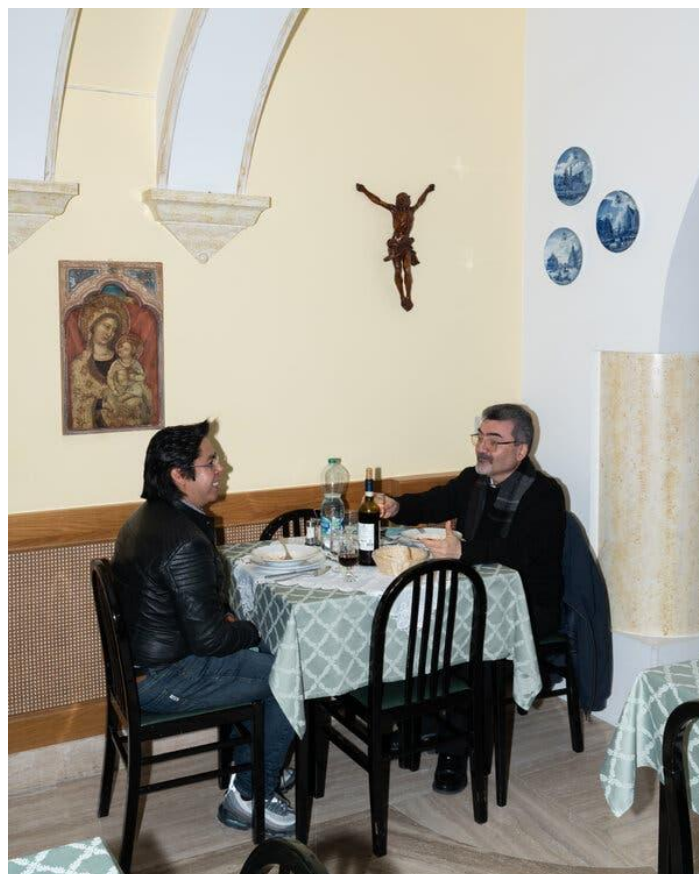
La struttura dispone anche di una semplice sala da pranzo.