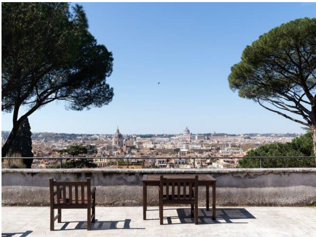
La vista dalla terrazza della Casa per Ferie San Giuseppe alla Trinità dei Monti.