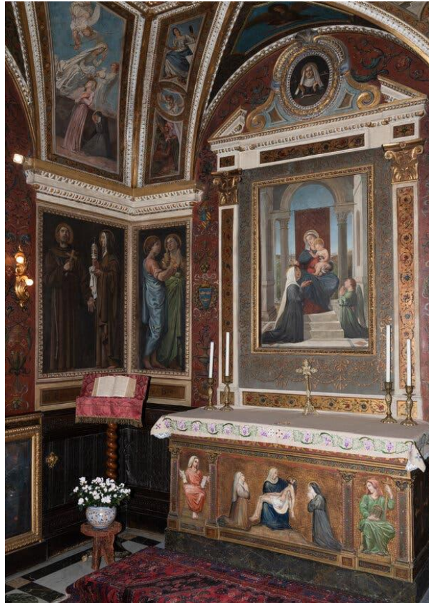
La Casa di Santa Brigida era originariamente la dimora di Santa Brigida, nata nei pressi di Stoccolma e trasferitasi a Roma nel 1349. La stanza in cui morì è oggi una cappella.