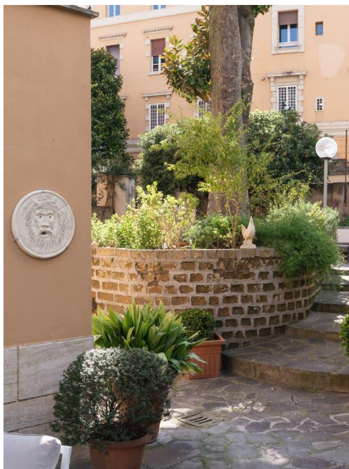
Il giardino della Casa per Ferie Maria Schinà.