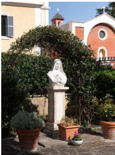
Il giardino della Casa per Ferie Maria Schininà, una delle circa 350 strutture collegate alla Chiesa cattolica a Roma.

Le camere della Casa per Ferie Missionarie Francescane (Via Pio VIII 16, 06-393-665-82, fdproma@tiscali.it) costano 55 euro per la singola e 90 euro per la doppia, colazione inclusa.