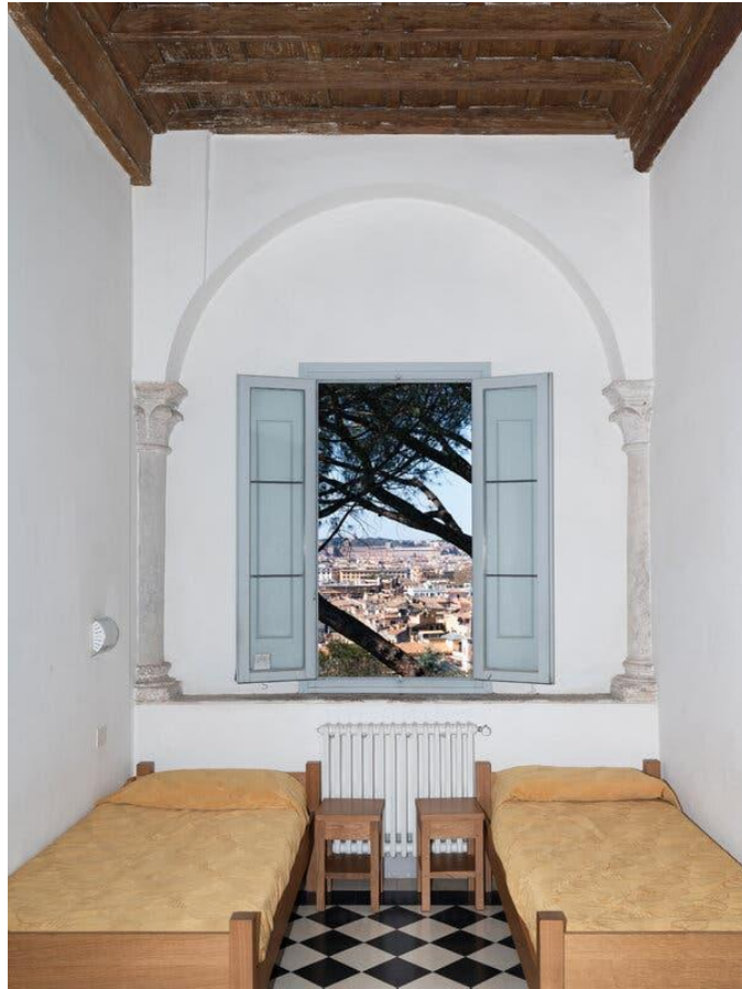
Le camere sono semplici; la vista è splendida.