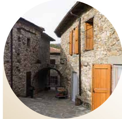
Casa vacanze "Il Portale"

Ampia e funzionale struttura con ideale per più famiglie oppure gruppi fino a 26 persone. Dispone di cucina ben attrezzata, ampia sala da pranzo, tre camere e due bagni in comune.