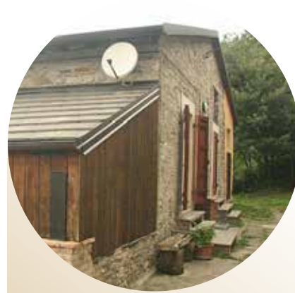
Casa vacanze "La Volta"

La struttura è ideale per una o due famiglie oppure per piccoli gruppi fino a 12 persone. Dispone di angolo cucina, sala da pranzo, due camere e due bagni.