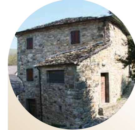
Casa vacanze "La Piagna"

La struttura è ideale per una o due famiglie oppure per piccoli gruppi fino a 14 persone. Dispone di cucina, sala da pranzo, tre camere e due bagni.