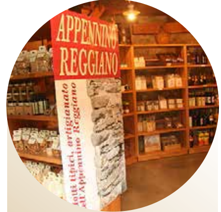
La bottega della castagna

Piccola bottega di prodotti tipici del territorio e di prodotti a base di castagna prodotti dalla azienda agricola Agriappennino di Cecciola.